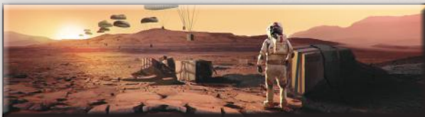
«Поставка снабжения» (Гарретт Каида)

Этот вариант игры можно использовать с любыми дополнениями. Теперь, вместо того, чтобы увеличивать глобальные параметры, ваша цель — повысить свой РТ до 63 за 14 поколений (или за 12, если вы играете с картами прологов). Пометьте 63-е деление золотым кубиком. В этом варианте игры добавляется новый стандартный проект «Буферный газ», который стоит 16 М€ и повышает ваш РТ на 1. В остальном действуют обычные правила игры в одиночку.