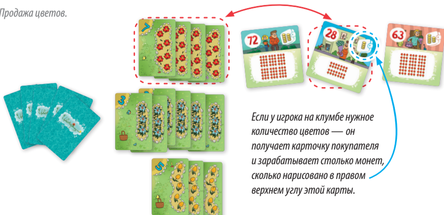
Рис.3. Продажа цветов.

Если у игрока на клумбе нужное количество цветов — он получает карточку покупателя и зарабатывает столько монет, сколько нарисовано в правом верхнем углу этой карты.