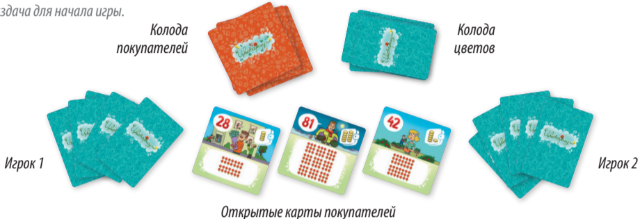
Рис.1. Раздача для начала игры.

Игроки ходят по очереди, по часовой стрелке, первым начинает ходить самый младший.